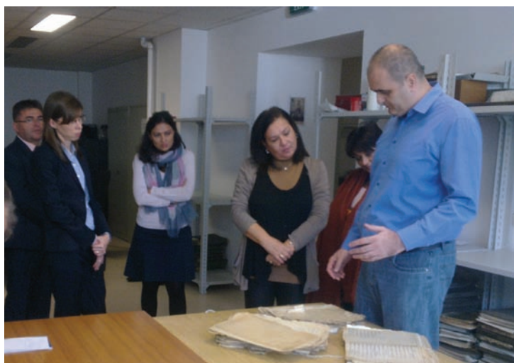
Посета дигиталном архиву РГЗ-а