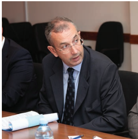
Мајкл Девенпорт, шеф делегације ЕУ

су циљеви пројекта врло важни, како у смислу непосредног остваривања пројектних задатака, тако и у ширем смислу који обухвата унапређење односа између Београда и Приштине.