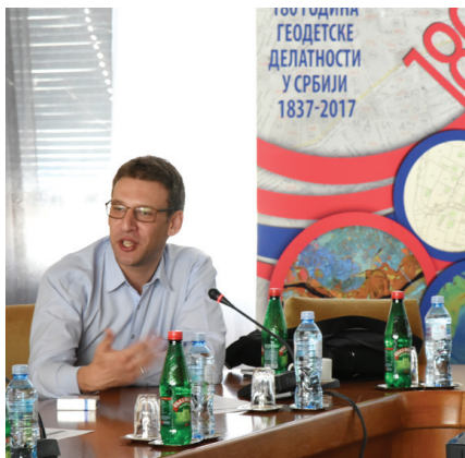
ката НИГП-а на тему размене података. Шведски експерти су представили

Наредног дана, 24. маја 2018. у Палати Србије одржан је округли сто на коме су учествовали представници надлежних министарстава, органа управе, стручних организација, јавних предузећа, Канцеларије за ИТ и еУправу, Сталне конференције градова и општина, УНДП-а а на коме је представљен предлог модела дељења података а затим и тренутно стање у геосектору у области сарадње субје-